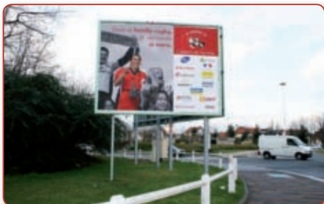
« Dans la famille rugby, je demande la mère... »