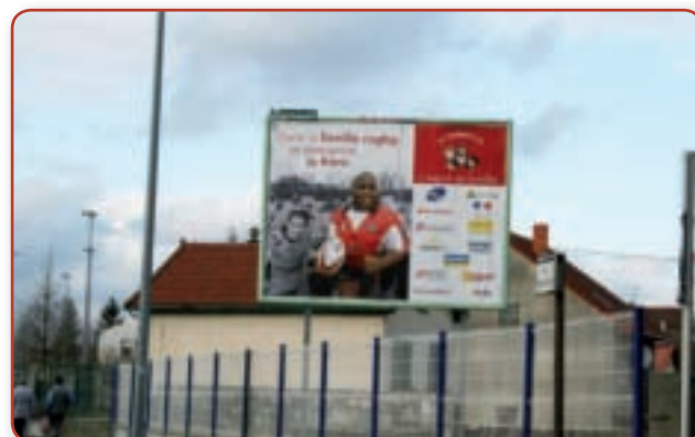
« Dans la famille rugby, je demande le frère »