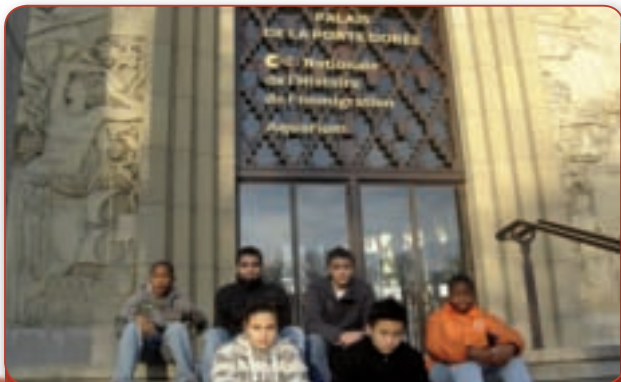
Un groupe de travail en visite au nouveau Musée de l'Immigration

Nous avons ainsi pu impliquer les clubs d'EPINAY et de LIVRY GARGAN et le Comité Départemental Rugby, bien sûr.